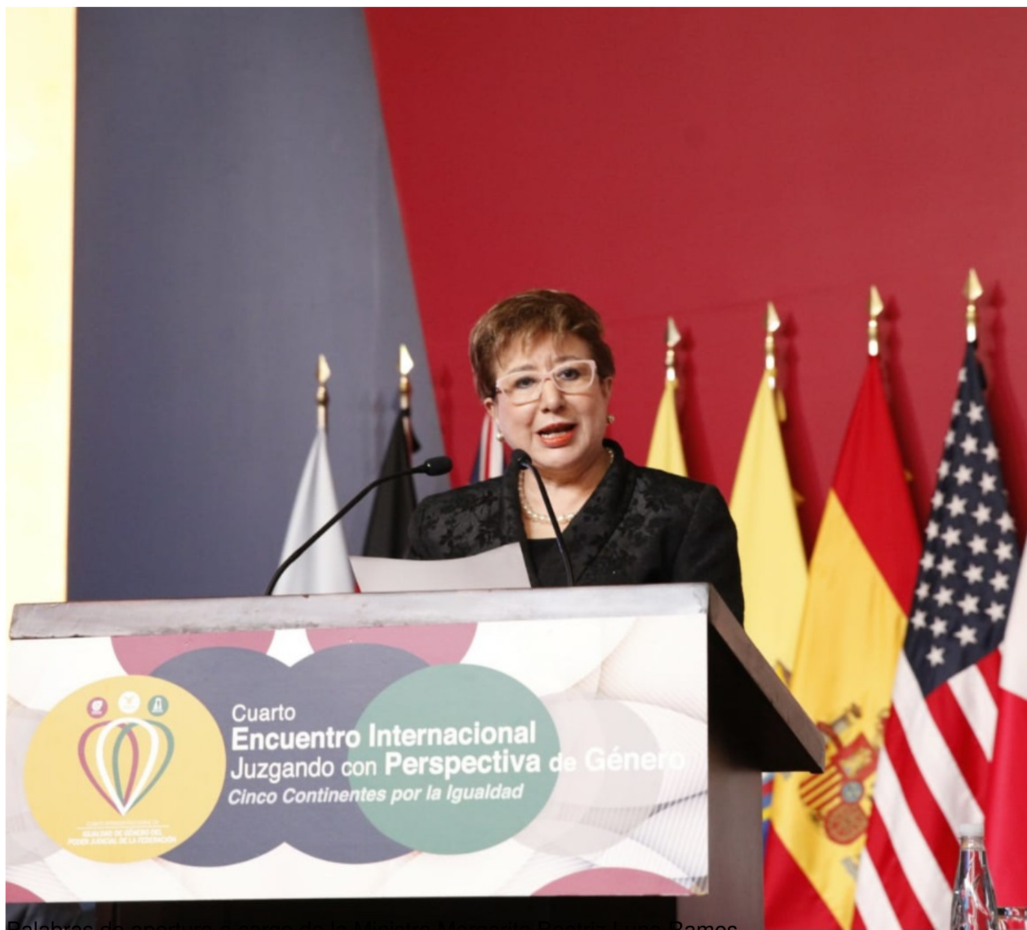
Palabras de apertura a cargo de la ministra Margarita Beatriz Luna Ramos